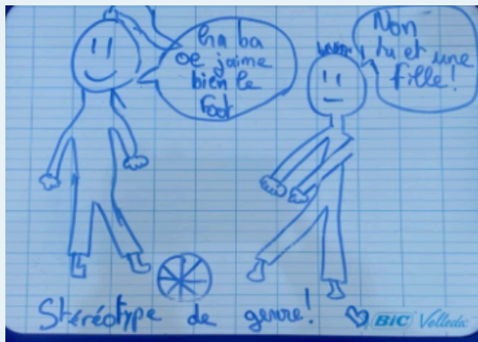
Dessin de jeunes sur les stéréotypes de genre lors d'un stand d'informations dans l'espace public

"Formatrice avec un sens de la pédagogie permettant de bien appréhender les différentes notions abordées" Formation professionnelle sur les violences au sein du couple